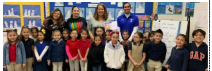
Tu Caracter Cuenta! Almuerzo con la Directora. - Justicia