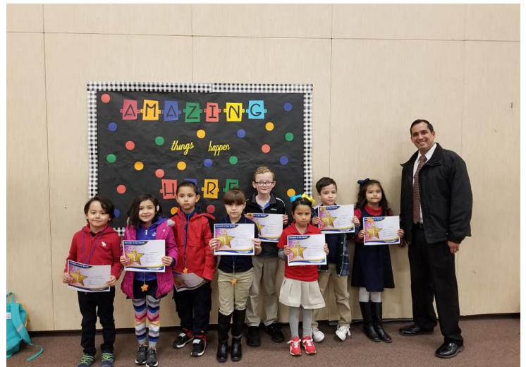
Cheetahs Del Mes